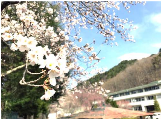
4月下旬、今年も綺麗に桜が咲きました。