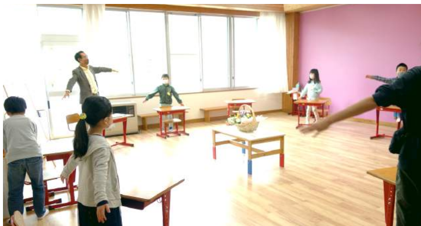
両手を広げて「ソーシャル・ディスタンス」を確かめます。