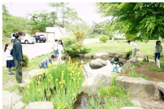
池の生き物たちも元気になってきました。