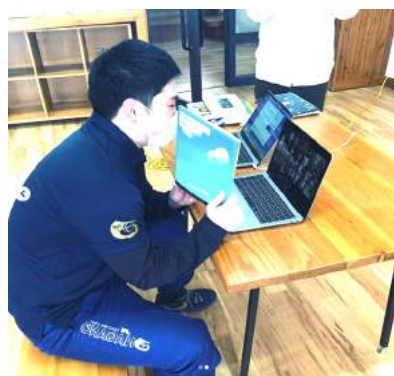
教職員による朝の読み聞かせ。