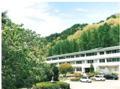
スクールバス乗車時、玄関前にて体調チェックと検温を実施します。