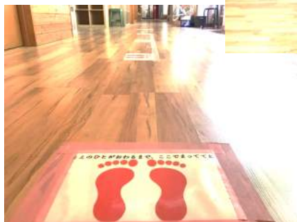
←学校再開に向けて 校舎内には様々な 掲示を用意。